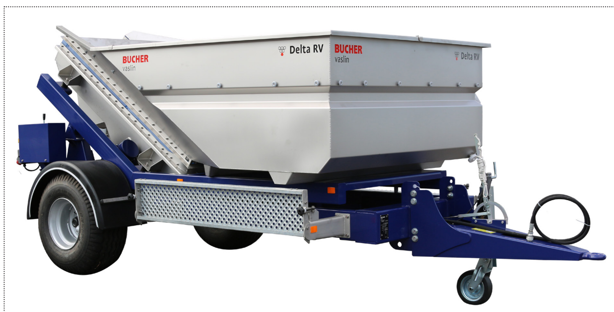
Delta RV con accessori