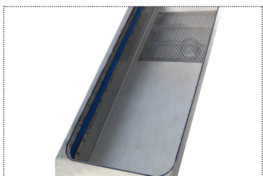
Piattaforma vibrante con griglia di sgrondo