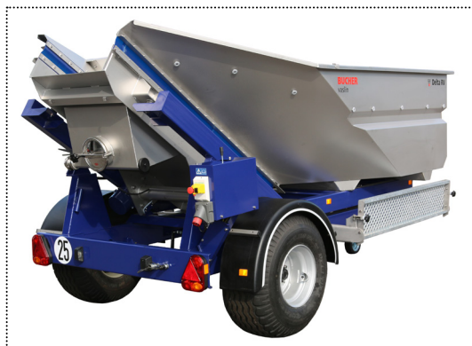
Delta RV con ruote a bassa pressione, Parafanghi e piedi stabilizzatori regolabili