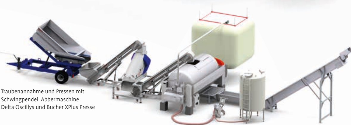
Traubenannahme und Pressen mit Schwingpendel Abbermaschine Delta Oscillys und Bucher XPlus Presse