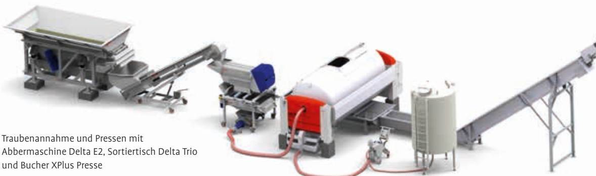
Traubenannahme und Pressen mit Abbermaschine Delta E2, Sortiertisch Delta Trio und Bucher XPlus Presse