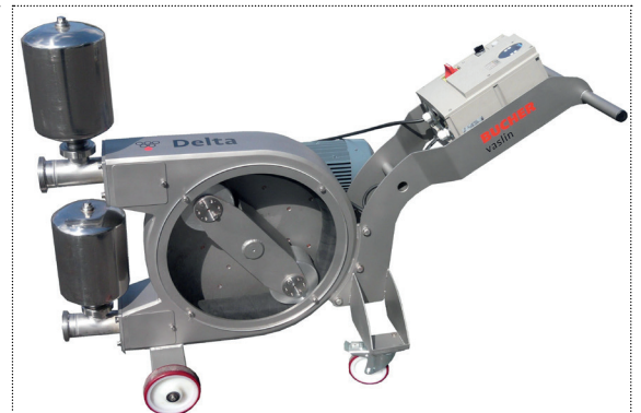
Schlauchpumpe für Wein

Die Delta DP Pumpe ist eine Schlauchpumpe für zwei Anwendungsgebiete: Fördern von Maische und Wein.