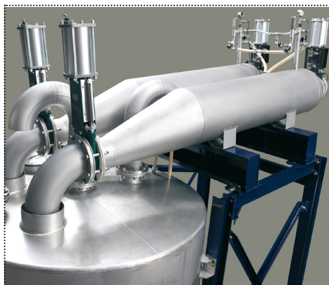
Módulo Delta Extractys